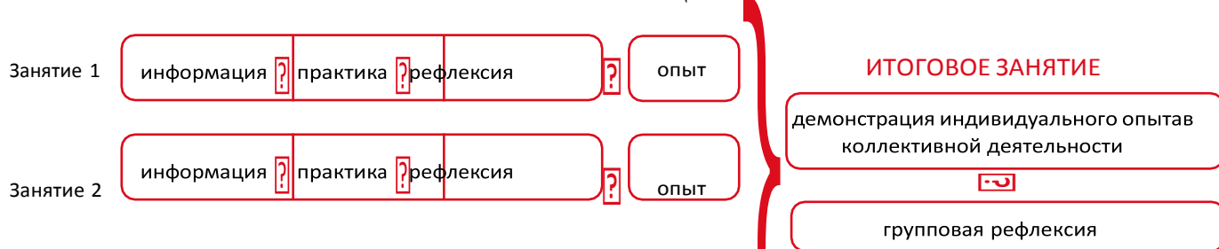
СХЕМА ОРГАНИЗАЦИИ СОБЫТИЯ

По окончании всех событий проводится итоговая игра, на которой дети демонстрируют полученные в течение учебного года знания и умения, подводят коллективные и индивидуальные итоги.